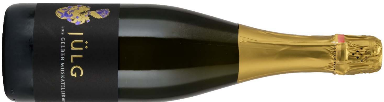
Gelber Muskateller Brut 2017, 14,00 Euro